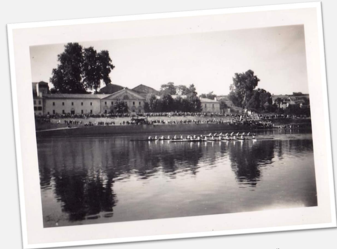
Régate de Huit en 1920 devant le Chai au Quai à Castillon la Bataille