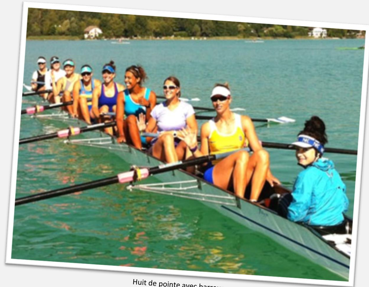
Huit de pointe avec barreur